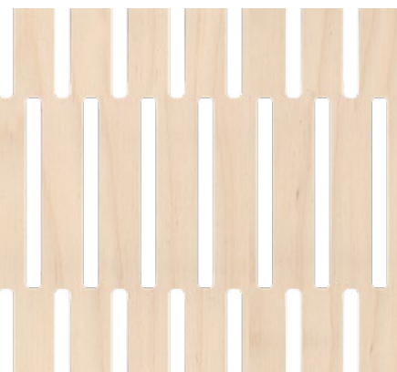
back side: 4/4 mm, plywood birch